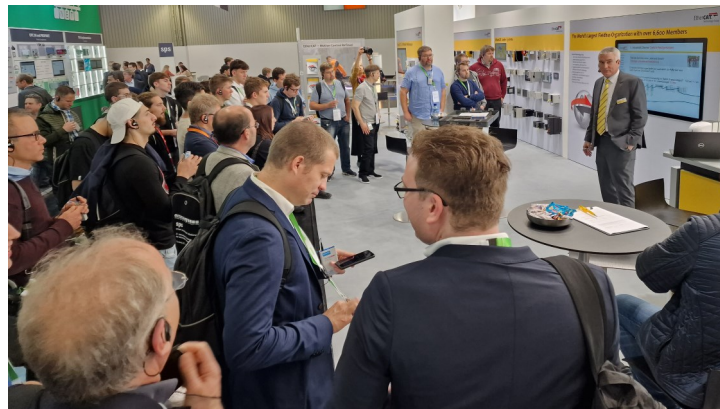
Guided Tour an der Messe